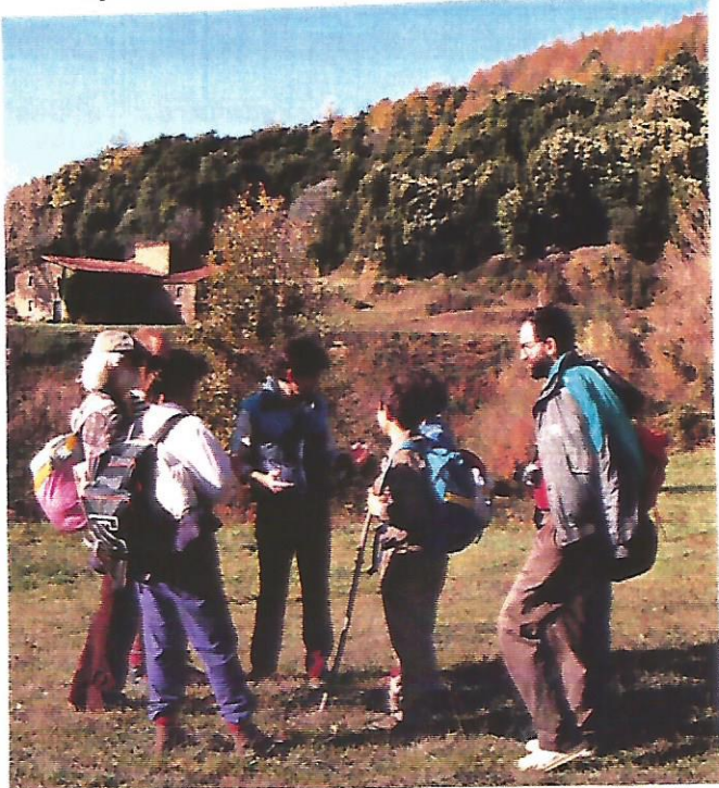
7 Fins a Santa Fe hem caminat pocs

Hem arribat al cim del Matagalls (1.695 m) i la boira es ja del tot espessa fins al punt que només ens ha quedat la creu com a punt de referència. Després,