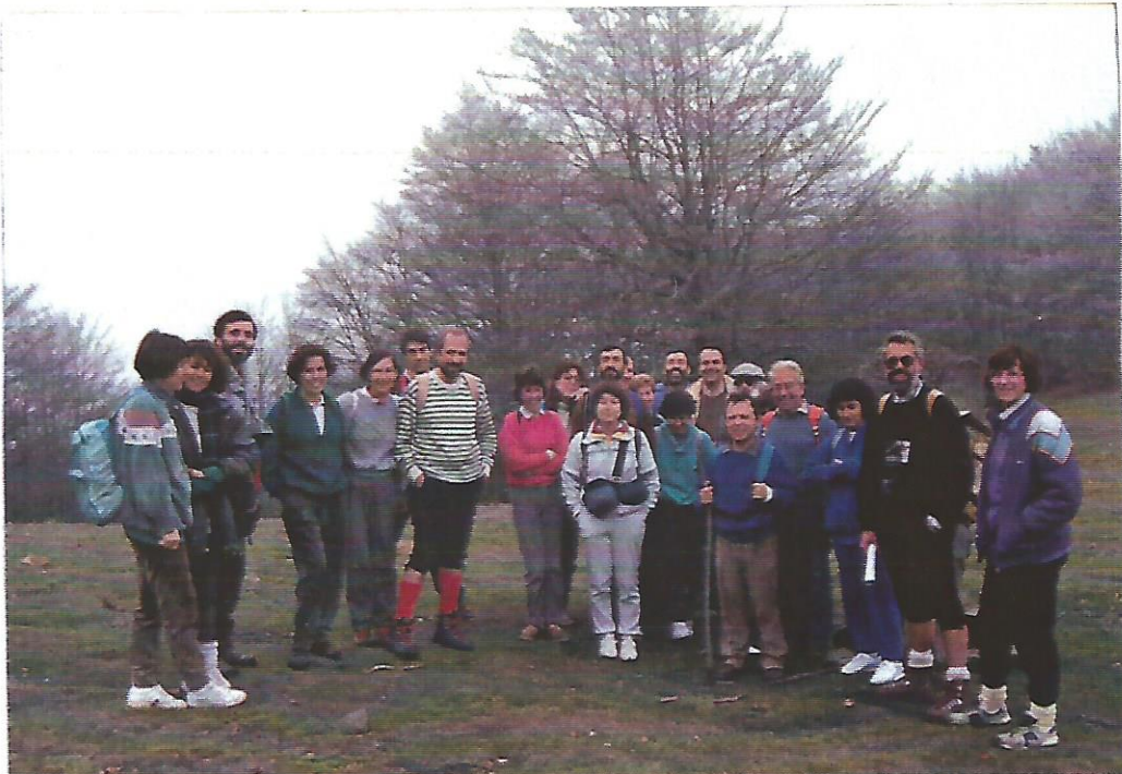
9 El Paraigua al Montseny

aprofitant algunes clarianes hem baixat en direcció a Viladrau tot passant pel Santuari de Sant Segimon (1.240 m) i per un camí força dificultós.