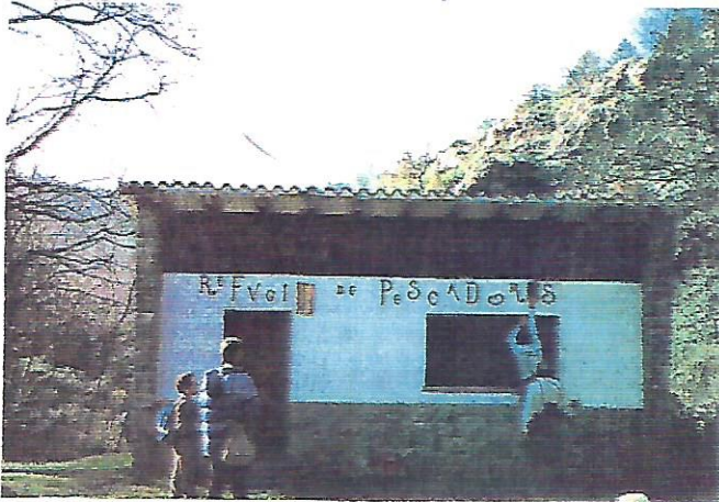
10 Tasca normalitzadora

Comença la trobada amb vaga de taxis i contradiccions horàries a la circular. Malgrat tot, el resultat no és greu i ens trobem "quasi" tots els que havíem de ser-hi. Però una sensació estranya pren forma al nostre ànim al posar el peu a l'autocar, és una sensació indefinible, com si en el fons tots els que hi som estiguéssim una mica sols i perduts. Perduts?, abans de començar l'excursió?