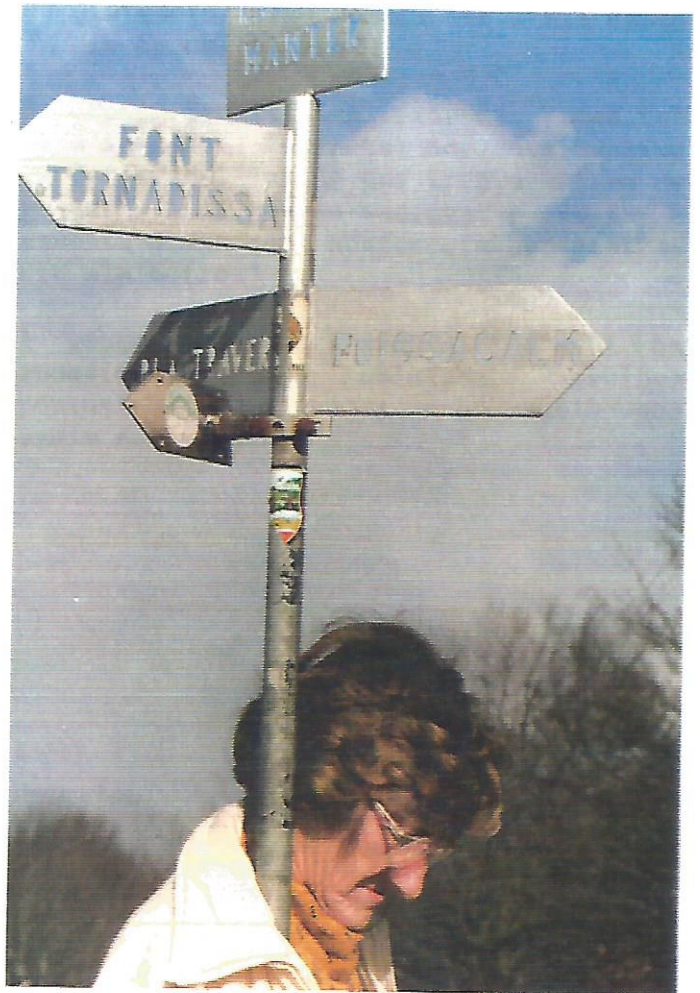
18 A punt de pujar el Puig Sacal

Allà hem dinat i la sopa d'all ha fet retornar els desvalguts. Evidentment aquest no és el nostre dia i per unanimitat hem decidit tornar a