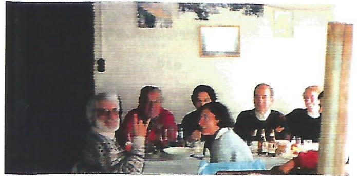
17 La sopa d'all fa retornar els desvalguts

A pesar d'estar el dia molt tapat per la boira hem decidit caminar, si més no, fins al Santuari de Cabrera perquè el camí és clar i senyalat. A mesura que hem anat pujant, però, la boira s'ha anat espessint més. Confiats que el camí no tenia pèrdua i refiats els uns dels altres ens hem trobat al Pla d'Aiats. Un cop reconegut l'error i sense queixes ni angoixes hem intentat buscar el camí més curt per arribar a dalt. De seguida ens hem trobat a l'peu de les escales i hem pujat fins a dalt, on la boira era tan espessa que fins que no hem topat amb el santuari no l'hem vist.