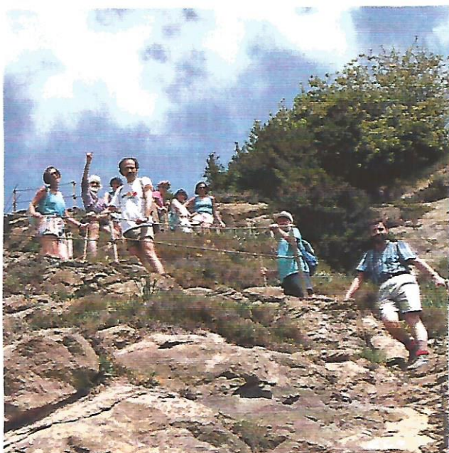
28 Pujant a Cabrera

L'autocar ens ha deixat al peu de la pista per on vam començar l'excursió l'altra vegada. Aquest cop, però, carregats d'experiència com anem, hem sabut encertar un camí obac que ens ha acabat duent fins a l'escalinata que puja dalt de tot de Cabrera.