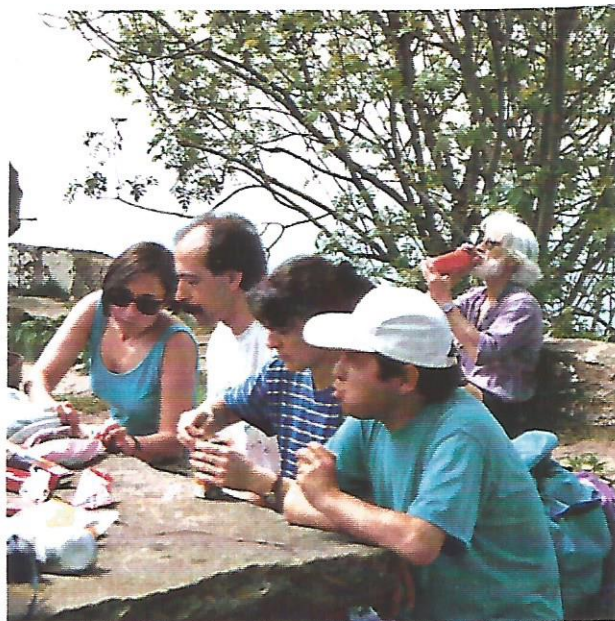
29 Quina gana...!

Hem fet tota la Serra de Llancers i hem acabat entrant en el misteriós bosc de la Grevolosa. Ho és tant, de misteriós, que hi hem descobert una heura que s'havia