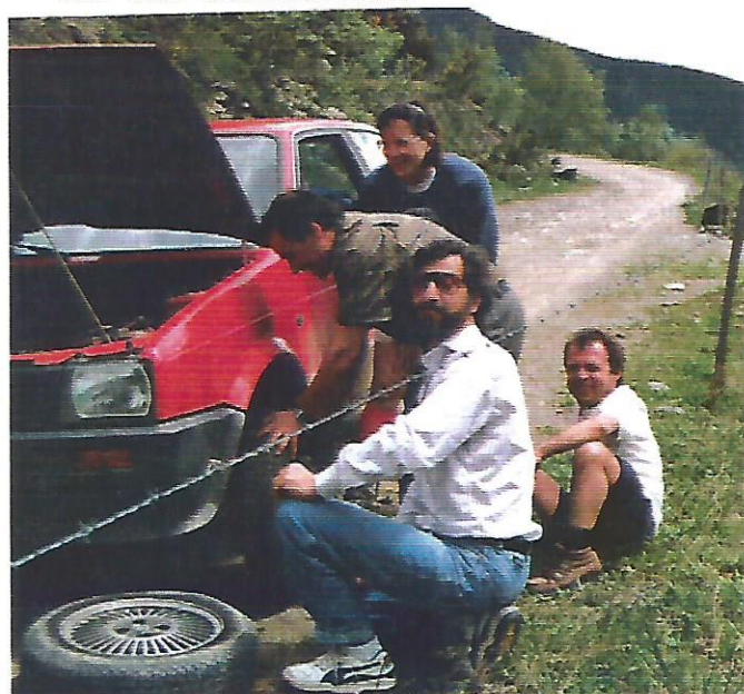
32 I algú canvia la roda dues vegades