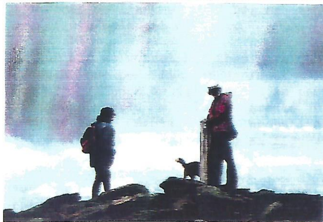
31 El temporal ens amenaça