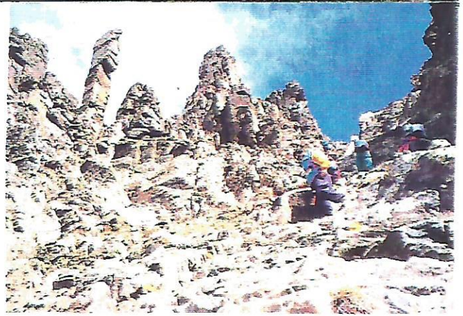
38 La xemeneia

El paisatge és esplèndid, el vent ha fet bona neteja, fins i tot es veu el mar. La ruta que hem caminat els dos dies queda clarament dibuixada des del cim. TV3 tampoc no era allí, però aquest cop les càmeres de fotografiar del Paraigüa no descansen. Un excursionista bona fe que