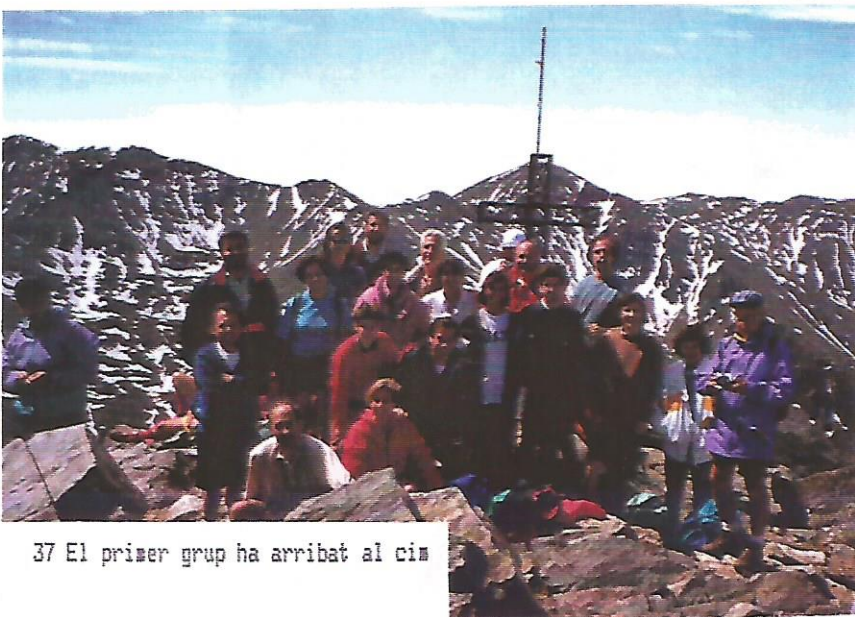
37 El primer grup ha arribat al cim